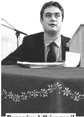
Buzogány lelkész zenél

Bizonyára Önök is megtapasztalják, hogy milyen kellemes énekhangja van Buzogány lelkésznek, amennyiben megnézik a videofelvételt, vagy meghallgatják a megfelelő hangfelvételt.