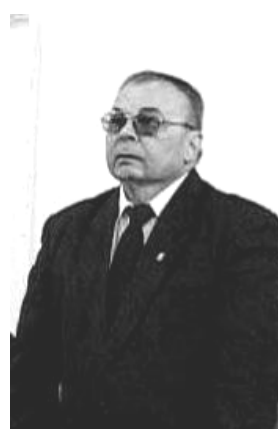
Főt. Rázmány Csaba

Köszönetemet fejezem ki a gyülekezet vezetésének, hogy