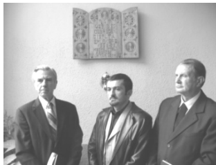
A beregi küldöttség