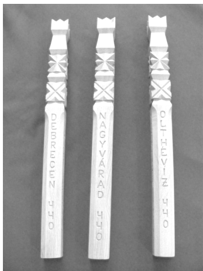
A három kopjafa

tartom: Olthévíz, nagyvárad, Debrecen. A többen pedig az első oldalon Debrecen és Olthévíz felirattal. Baloldalon az 1568-as évszámmal, amit a kezdetnek tekinthetünk. Jobb oldalon a 2008-as évszámmal, amely a mai napot, a mai pillanatot rögzíti. A kettő között pedig a 440 év.