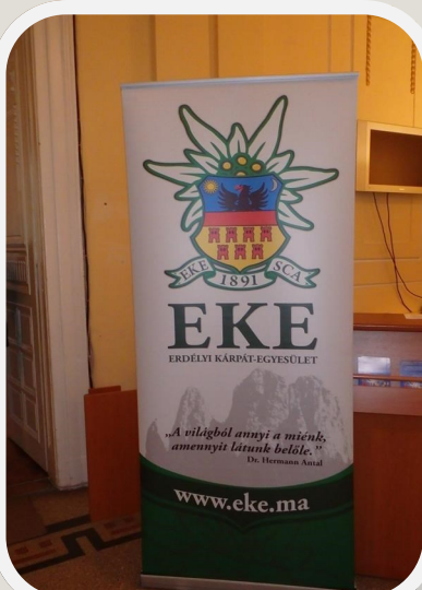
A kulturált természetjárás követői