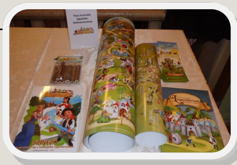
Zete, Firtos és a többiek